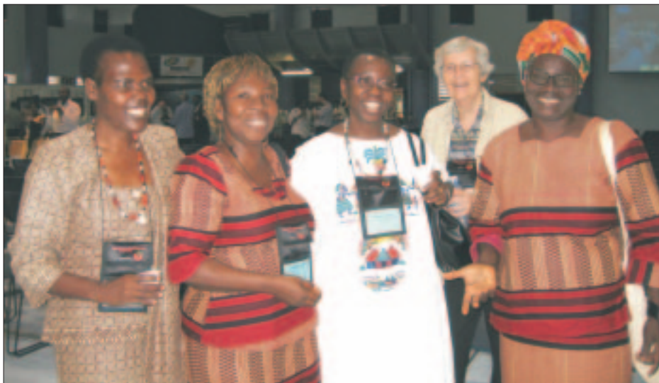
Les membres du Cercle a la 9eme Assemblée du Conseil Oecuménique des Eglises a Porto Alegre, Brésil:

africaine, christianisme, islam et judaïsme. Il comprend des femmes africaines et entretient des liens avec des femmes américaines, asiatiques ou européennes d'origine africaine. Elles sont en dialogue avec les cultures, les religions, les écritures sacrées et les histoires orales qui donnent une identité aux femmes du continent Africain.